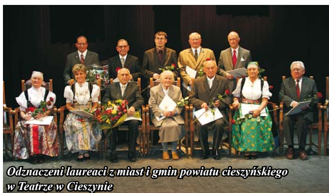
Odznaczeni laureaci z miast i gmin powiatu cieszyńskiego w Teatrze w Cieszynie