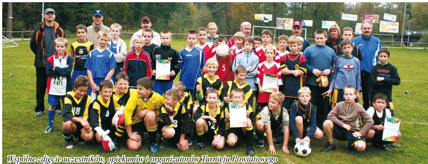
Wspólne zdjęcie uczestników, opiekunów i organizatorów Turnieju Powiatowego