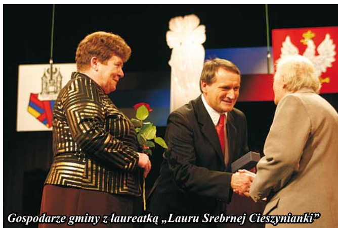
Gospodarze gminy z laureatką „Lauru Srebrnej Cieszyńianki”