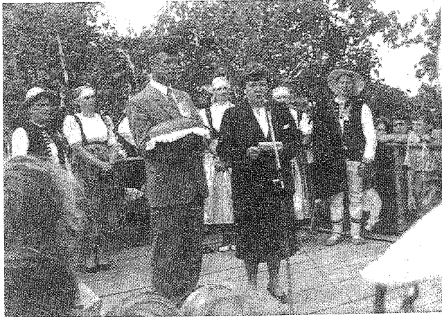
Uroczystości dożynkowe w Koniakowie

Już od dłuższego czasu społeczeństwo wsi Koniaków żyło sprawą nadania sztandaru OSP w Koniakowie Centrum.