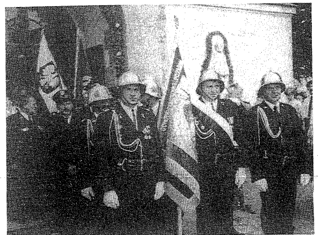
Poczet sztandarowy jednostki OSP Koniaków w chwilę po poświęceniu sztandaru