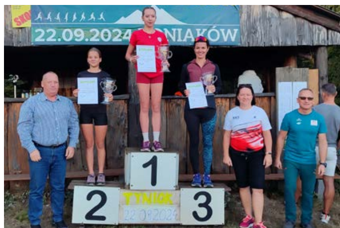
> Kobiety OPEN