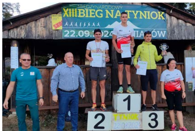
> Mężczyźni OPEN