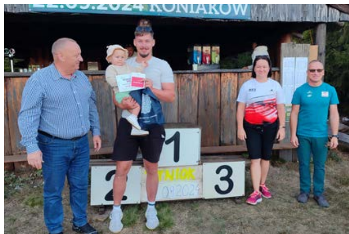
> Najmłodszy uczestnik