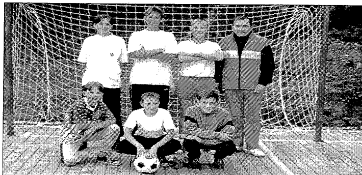
Zwycięska drużyna z SP 1 w Koniakowie ze swoim opiekunem

Trzecie miejsce Szkoły Podstawowej Nr 1 Istebna, Czwarte miejsce Szkoły Podstawowej Nr 2 Istebna Zaolzie, Piąte miejsce Szkoły Podstawowej Nr 2 Jaworzynka. Tytuł najlepszego strzelca zdobył Krężelok Grzegorz z Istebnej. Najlepszego bramkarza Gazur Paweł z Istebnej. Najlepszego zawodnika turnieju Michałek Andrzej z Zaolzia.