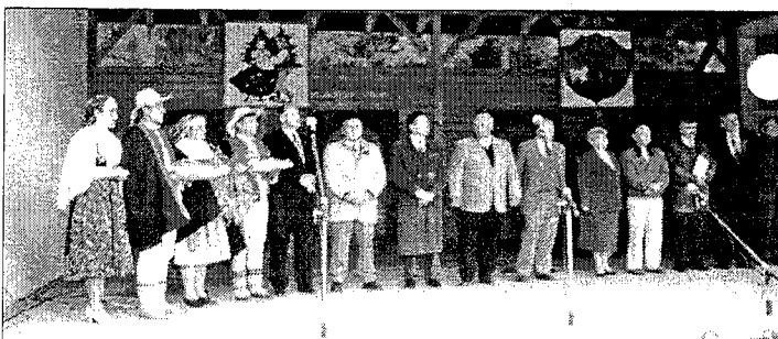
Gazdowie dożynek, goście i władze na estradzie „Pod skocznia”