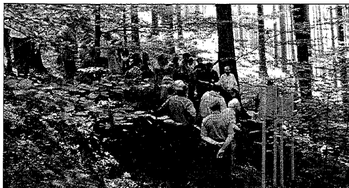
Drzewostan nasienny w Leśnictwie Bukowiec