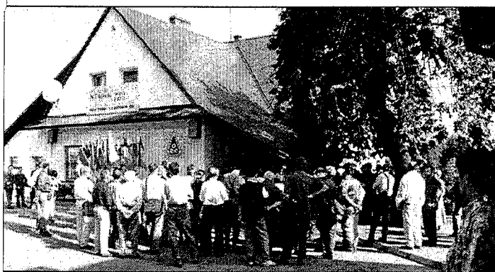
Powitanie gości przed Ośrodkiem Edukacji Ekologicznej w Istebnej