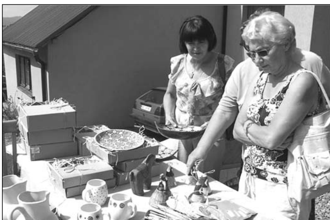
Pokaz ceramiki podczas „Dni Koronki”