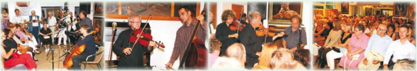
Występuje Józef Skrzek