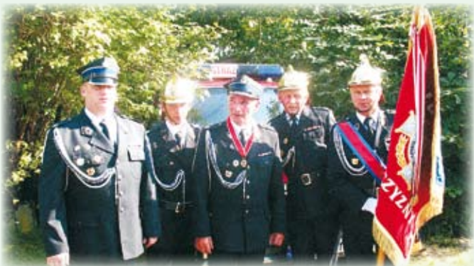
Odnaczony z poczem sztandarowym swojej jednostki