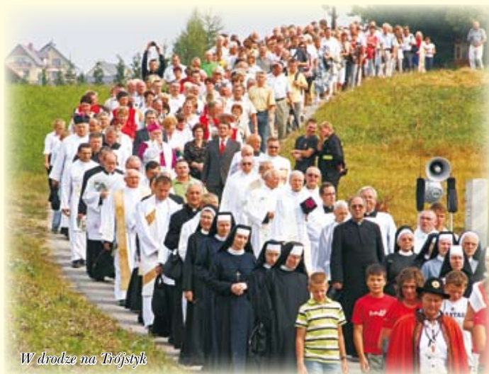
W drodze na Trójstyk