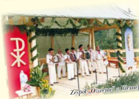
Zespół „Ozwońa” z Ciernego