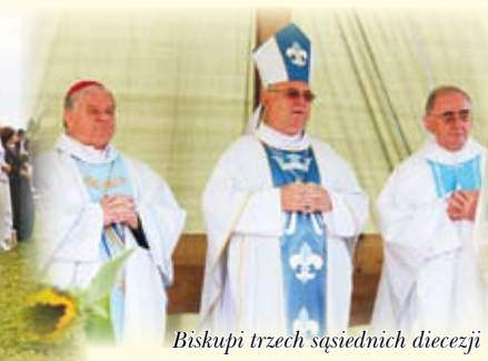
Biskupi trzech sąsiednich diecezji