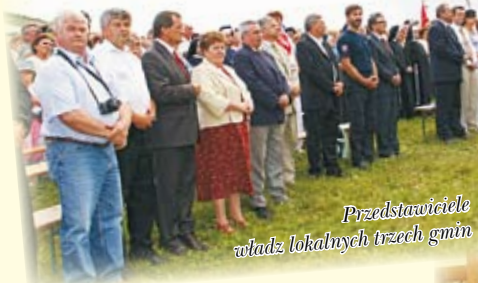
Przedstawiciele władz lokalnych trzech gmin