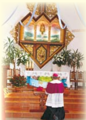
Biskup Rakoczy w kościele na Trzycatku rozpoczyna modlitwę