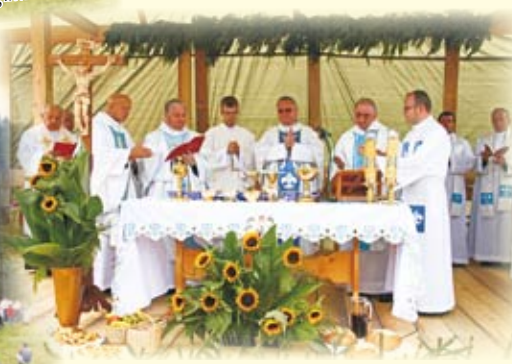
Księża i biskupi sprawujący eucharystię