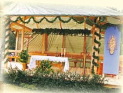
Oltarz wykonała firma Stollux, a wystrój parafianie z Trzycatku