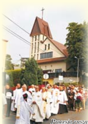
Procesja rusza z kościoła na Trzycatku