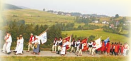
Poczty sztandarowe w procesji na Trójstyku