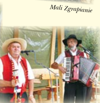
Czeski zespół folklorystyczny