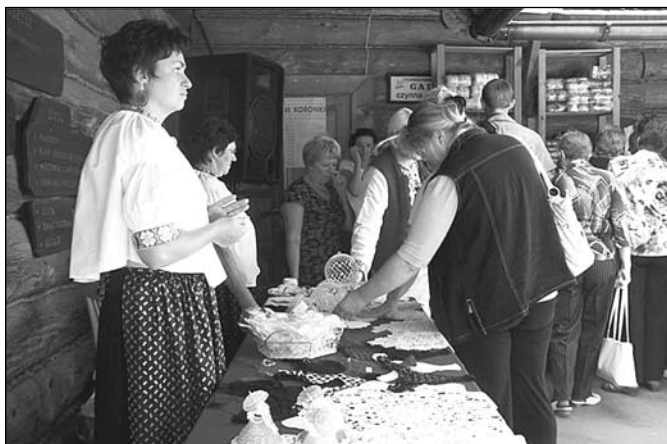
„Dni Koronki” w Koniakowie

15 i 16 sierpnia odbyły się Dni Koronki w Koniakowie przy Karczmie Kopyrtolka . Organizatorzy przygotowali wiele ciekawych i oryginalnych atrakcji, warsztaty ceramiczne dla dzieci, pokaz koronek i rękodzieła ludowego. W Galerii T. Ruckiego można było zobaczyć malarstwo i wystawę fotograficzną „Grejże mi muzyczko”, która przedstawia pierwszych muzykantów z Koniakowa. Można było również obejrzeć ciekawe filmy, o artystach ludowych z gminy Istebna, o Janie Wałachu, Zespole Regionalnym „Koniaków”. Nie zabrakło również dobrego jadła, serwowanego w Karczmie Kopyrtolka, z jednej z placków z blaszy i wielu innych góralskich przysmaków. Rozegrano dwa konkursy: Konkurs „Gry na Trąbicie” , w którym mogli brać udział tylko turyści oraz Konkurs na