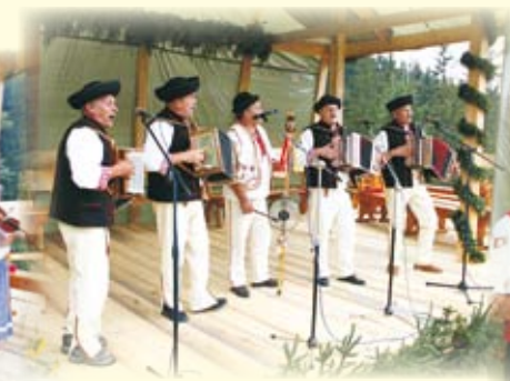
Heligoniści z Kisuczy na Słowacji