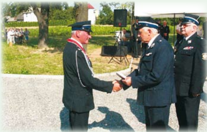
Złoty Medal Związku wręczają wiceprezes Zarządu Wojewódzkiego i prezes Zarządu Powiatowego