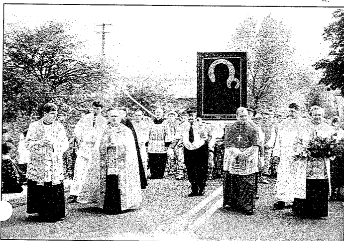
Za chwilę obraz zostanie wprowadzony do Kościoła w Koniakowie