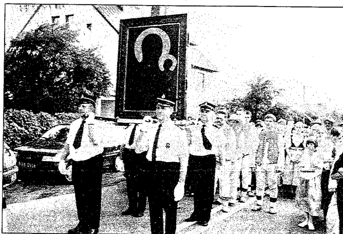
Od przedstawicieli rodzin Obraz na swoje ramiona przejęli strażacy