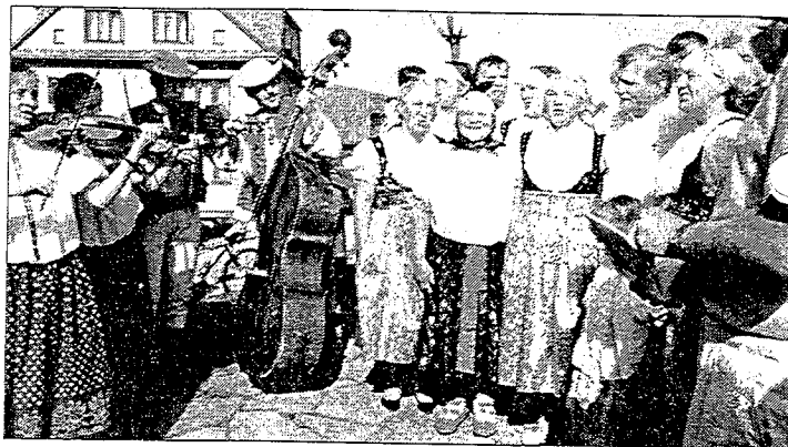
Lech Wałęsa wśród górali przed muzeum „Na Grapie” w Jaworzynce.