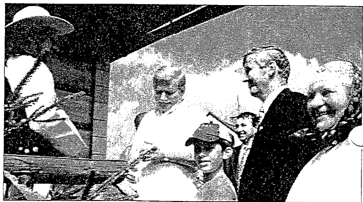
Powitanie Lecha Wałęsy na progu muzeum.