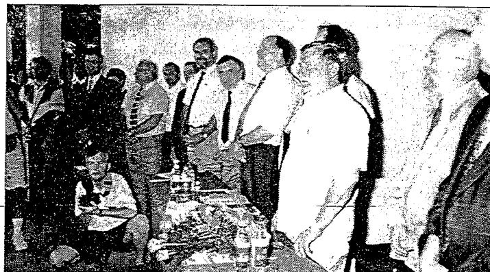
Lech Wałęsa z towarzyszącymi osobistościami w amfiteatrze „Pod Skocznią” w Istebnej.