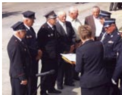
Wyróżnienia i odznaczenia dla strażaków - weteranów (50 lat i 55 lat działania w OSP).

Zakupiono też dla jednostki pompę pływającą oraz agregat prądotwórczy. Strażacy posiadają umundurowania w których występują w akcjach ratowniczych i różnego rodzaju zawodach i imprezach. Niektóre rzeczy kupujemy z własnych środków, ale w większości na cele bojowe otrzymujemy ze środków od Urzędu Gminy w Istebnej. Straż nasza w obecnym czasie bierze udział oprócz akcji bojowych, w różnych zawodach i szkoleniach z innymi jednostkami na terenie całej Gminy. Uroczystość 75-lecia, którą zorganizowaliśmy była wspaniałym podziękowaniem za dotychczasowy trud społecznego zaangażowania. Poprzednie zarządy, oraz obecny włożyli wiele wysiłku w kierunku rozwijania się straży pożarnej za co z całego serca wszystkim dziękuję i proszę o dalszy wysiłek i zaangażowanie do pomocy dla drugiego człowieka.