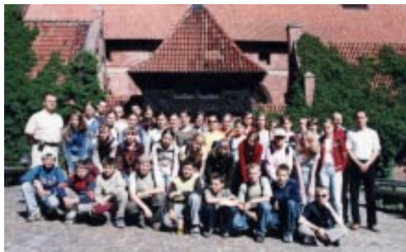
Koloniści w Malborku.

Były też dyskoteki, ogniska oraz karaoke. W każdą niedzielę cała kolonia uczestniczyła we Mszy św. w miejscowym kościele. Razem z organizatorem dzieci śpiewały pie-