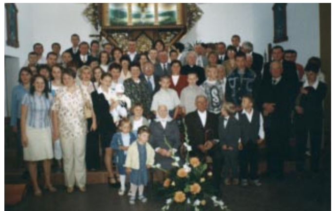
Jubilaci z najbliższą rodziną w kościele p.w. Matki Boskiej Frydeckiej na Trzycatku w Jaworzynce.

Życzenia dalszych lat życia w zdrowiu i pomyślności składają Jubilatam Wójt Gminy oraz Kierownik USC.