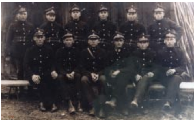
Założyciele OSP Jaworzynka Centrum - 1929 r.