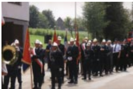
Przemarsz pocztów sztandarowych i strażaków do remizy.