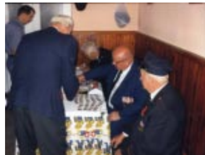
Przy tablicy pamiątkowej z gwóźdźkami.

Szczególne podziękowania dla biorących udział w tej uroczystości, a w szczególności władzom z Państwowej Straży Pożarnej z Powiatu, Jednostce Ratowniczej z Polany, Przewodniczącemu Rady Gminy, Radnym, Pocztom Sztandarowym, delega-