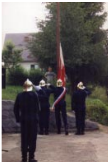
Wciągnięcie flagi na maszt.

Do gaszenia pożarów używano wiader. W krótkim czasie ze składek ludności zakupiono ręczną pompę ciągniętą przez zaprzęg koni. W 1931 roku wybudowano w czynie społecznym drewnianą remizę, w której można było już przechować sprzęt oraz robić zebrania i dalej rozwijać się. W czasie okupacji zawieszono działalność straży, ale już po wojnie zaczęli mocno działać, organizując różnego rodzaju imprezy oraz zbiórki po domach, nabywano dalszy sprzęt potrzebny do gaszenia pożarów. W 1959 roku nabyło pierwszy samochód z napędami na dwie osie pochodzący z wojny. Budowano baseny przeciwpożarowe, które do dzisiaj służą jako zapasy wody do gaszenia pożarów. Strażacy podnosili kwalifikacje na kursach i szkoleniach, biorąc udział we wszystkich akcjach bojowych i ćwiczeniach. W 1962 roku straż