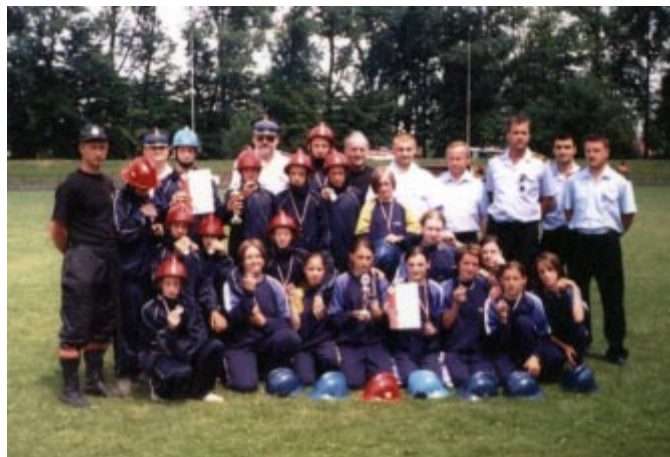
Drużyny z OSP Koniaków C. z sędziami i opiekunami.