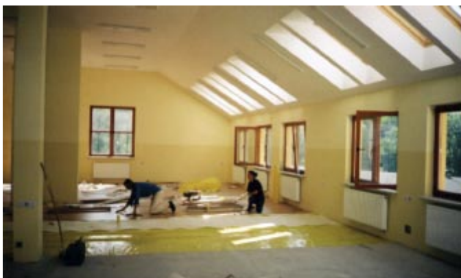
Układanie podłogi panelowej w bibliotece i czytelnii.

Budynek - segment „C” - stanowi zaplecze dla prawidłowego funkcjonowania szkoły. Na parterze zlokalizowana jest kuchnia z pomieszczeniami magazynowymi oraz świetlica i stołówka, na której jednorazowo będzie można wydać około 100 obiadów. Na górnej kondygnacji zlokalizowana jest biblioteka z czytelnią i magazynem książek. W czytelnii wykonano również sieć komputerową i w przyszłości można będzie wyposażać ją w stanowiska komputerowe. W piwnicach znaj-