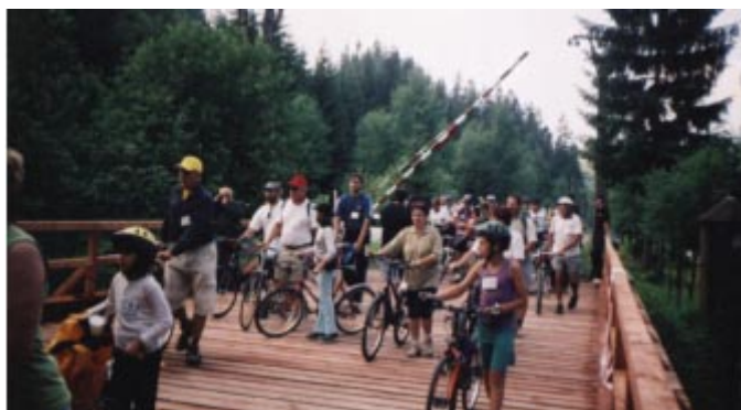
Most otwarty - uczestnicy rajdu ruszyli!

Później zostaliśmy oczarowani pełnią swoistego piękna i uroku doliną, którą rzeka Olza przedarła się z północy na południe Beskidów. Miejsce to, jak legenda głosi, chciał przegrodzić sam Lucyfer, ale nie zdążył przed świtem, bo zapiał kogut. Nie udało się już w czasie II wojny światowej przegrodzić doliny Niemcom, by zebrane wody Olzy stały się zbiornikiem wodnym dla Huty Trzynieckiej.