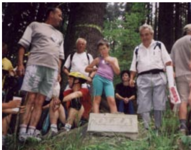
U samego źródła Olzy.

Pod Młodą Górą schodzimy z rowerów, by znaleźć się w miejscu, w którym widoczne są meandry Olzy. O 15.00 ostatni kolarz przejeżdża most–granicę w Bukowcu.