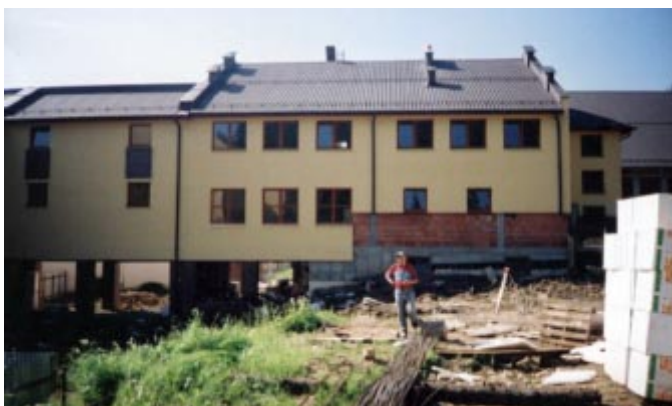
Widok od strony lasu.

Dobiegają końca prace przy budowie hali gimnastycznej i segmentu „C” szkoły Gimnazjalnej w Istebnej. Co prawda termin zakończenia robót przypada na 30 sierpnia to już dzisiaj zakończono roboty budowlane na segmencie „C”. Realizacja przebiegała zgodnie z przyjętym harmonogramem i wykonawca wywiązał się z zadeklarowanej oferty.