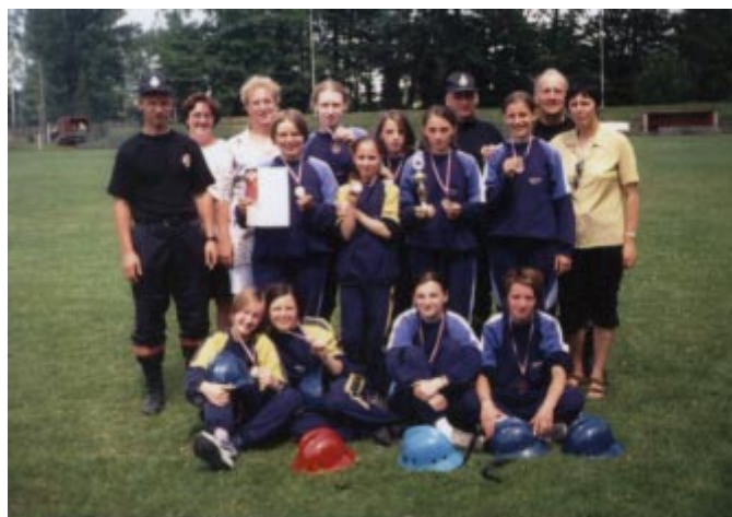
Drużyna dziewcząt z władzami gminnymi OSP i opiekunami.