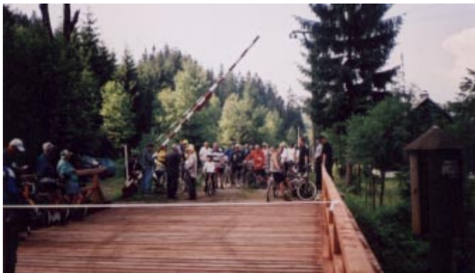
W oczekiwaniu na otwarcie mostu.

W 2001 r., na progu trzeciego tysiąclecia, powstała na terenie przygranicznym w Jabłonkowie i Trójwsi, bardzo ciekawa impreza: „Rowerem do źródeł Olzy”. Sam pomysł, by w Dzień Ziemi (22 kwietnia) wyruszyć na rowerze z Lasu Miejskiego w Jabłonkowie (Republika Czeska) w górę rzeki do jej źródeł na Gańczorze (Rzeczypospolita Polska) ma oprócz swych bezsprzecznych walorów krajoznawczych i kilka nowatorskich myśli. Jedną z nich jest wykorzystanie potężnego, drewnianego mostu na Olzie w Bukowcu „Przy Starej Strażnicy” należącego do Czeskiego Nadleśnictwa, który jest częścią granicy państwowej i od dziesiątek lat jest zamknięty dla ruchu turystycznego. Most ten jest symbolem na dzień dzisiejszy zmian, jakie w stosunkach między Rzeczypospolitą Polską a Czechami zaistniały.