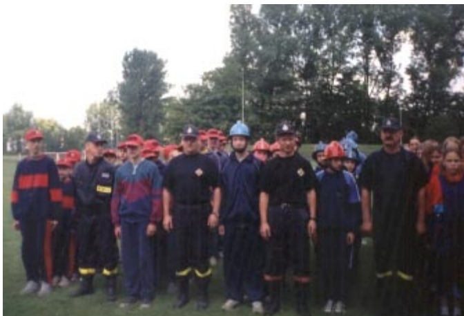
Drużyny strażackie z gminy Istebna wraz z opiekunami.