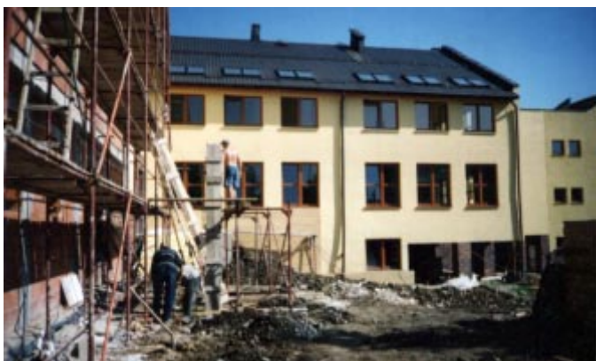
Widok od drogi głównej.

Dobiegają końca prace przy budowie hali gimnastycznej i segmentu „C” szkoły Gimnazjalnej w Istebnej. Co prawda termin zakończenia robót przypada na 30 sierpnia to już dzisiaj zakończono roboty budowlane na segmencie „C”. Realizacja przebiegała zgodnie z przyjętym harmonogramem i wykonawca wywiązał się z zadeklarowanej oferty.