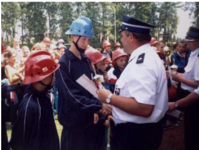
Dowódca drużyny chłopców z Koniakowa C. przyjmuje puchar i dyplom.