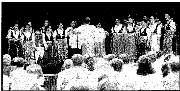
Śpiewa chór Szkoły Podstawowej nr 1 z Jaworzynki

W niedzielę 21 czerwca na deskach Amfiteatru „Pod Skocznią” miał miejsce Przegląd Zespołów Regionalnych Gminy Istebna – pierwsza tego typu impreza na terenie Trójwsi. W konkursie wzięło udział pięć zespołów („Istebna”, Dziecięcy Zespół SP nr 2 Istebna Zaolzie, „Mały Koniaków”, Zespół Dziecięcy SP nr 1 Jaworzynka, „Koniaków”), prezentując programy oparte o obrzędowość doroczną i rodzinną.