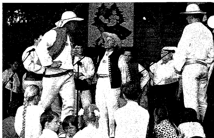
Występ zespołu „Jaworzynka” z Jaworzynki