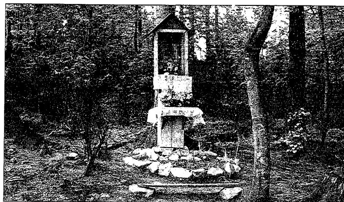
Istebna Wilcze Polanka las