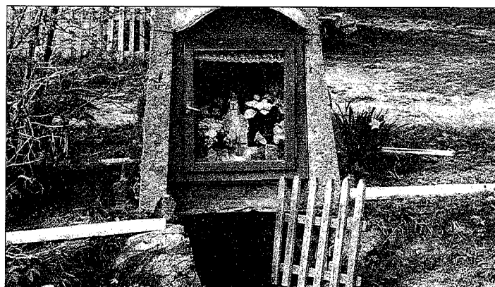
Kapliczka na źródełku wody; u Lolka - Koniaków - Bukowski