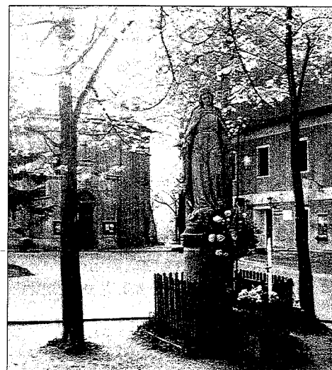
Istebna Centrum - koło kościoła

Bilans działalności dokonań II kadencji przedstawimy szerzej w następnym numerze „Naszej Trójwsi”.