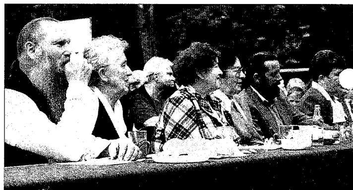
Jurzy przystuchują się występom dzieci