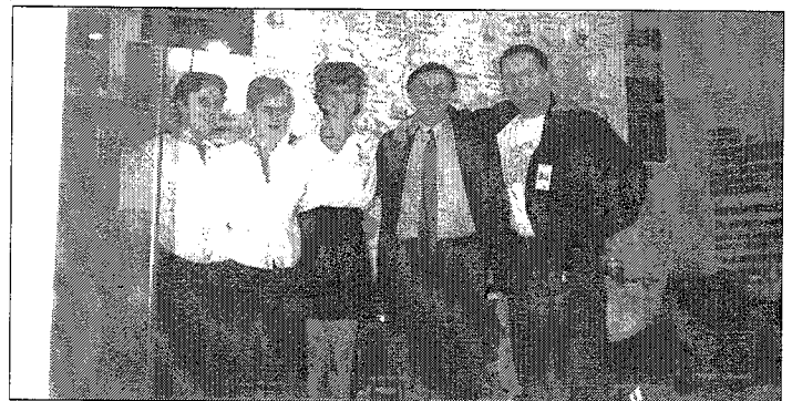
Targi turystyczne - Glob '98 - Katowice

Udział w targach turystycznych powinien przynieść w niedługim czasie wymierne efekty w postaci liczniej niż dotychczas odwiedzających nasz region turystów.