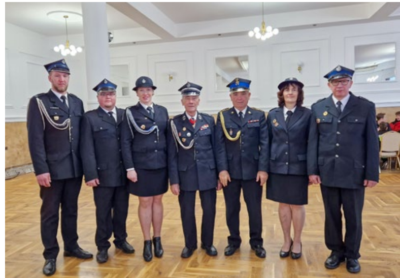
> Z rodziną i wnukami podczas obchodów Dnia Strażaka, 2023 r.