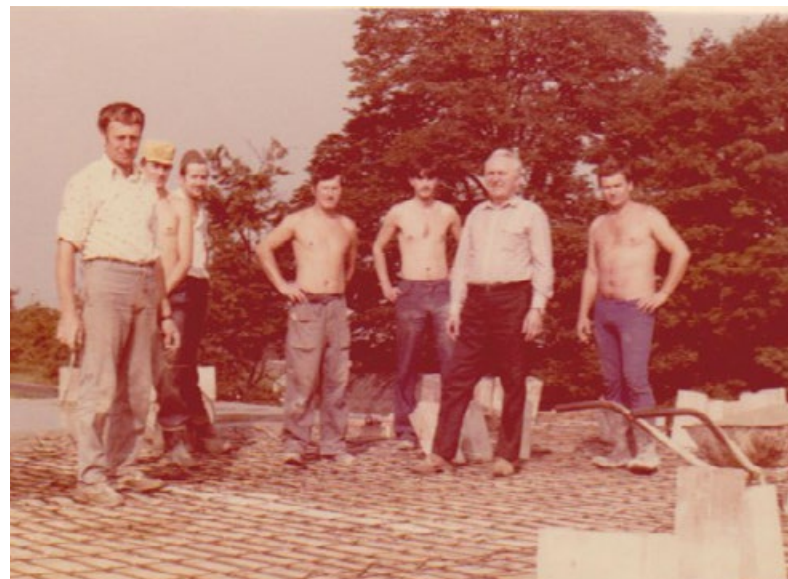
> Budowa strażnicy OSP w Koniakowie, 17.08.1984 r.