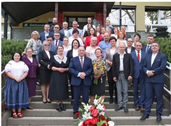
Nowy wójt Gminy i Rada Gminy Istebna