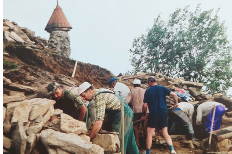
> Rozbudowa kapliczki na Ochodzitej w 2000 r.