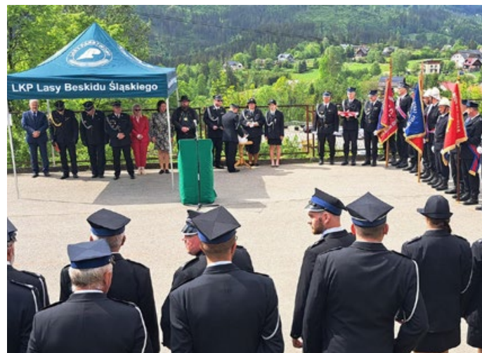
Gminne obchody Dnia Strażaka