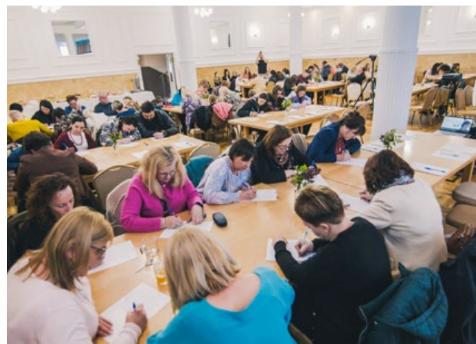
Dyktando im. Pani Haliny