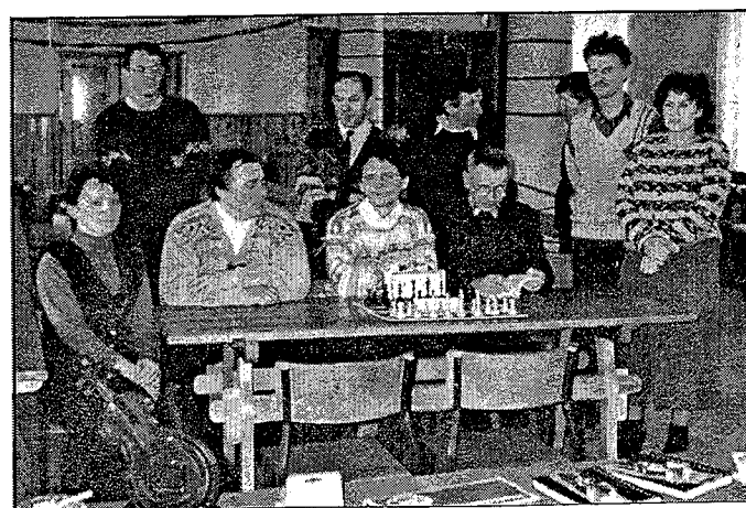
N/z Uczestnicy Turnieju Szachowego