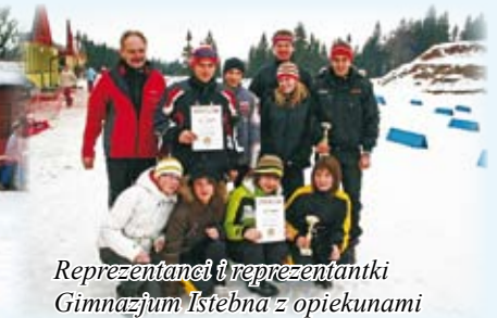
Reprezentanci i reprezentantki Gimnazjum Istebna z opiekunami