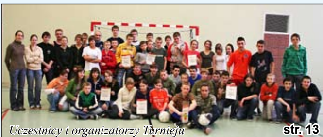
Uczestnicy i organizatorzy Turnieju