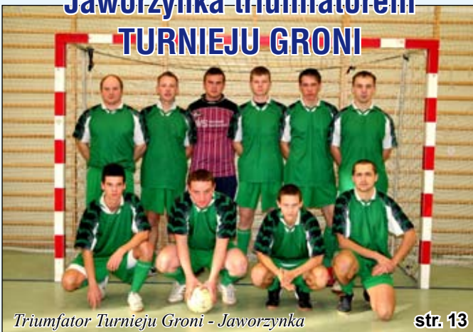
Triumfator Turnieju Groni - Jaworzynka