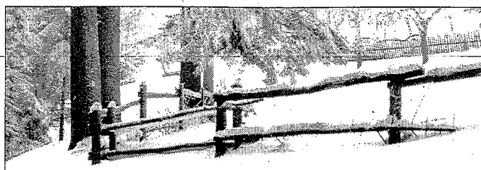
Zima znów wróciła