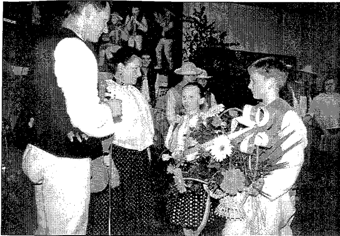
Życzenia składają najmłodsi - IV pokolenie „zespolaków”.