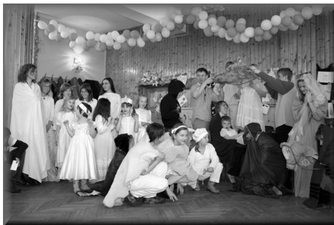
3. Fragment przedstawienia jasełkowego