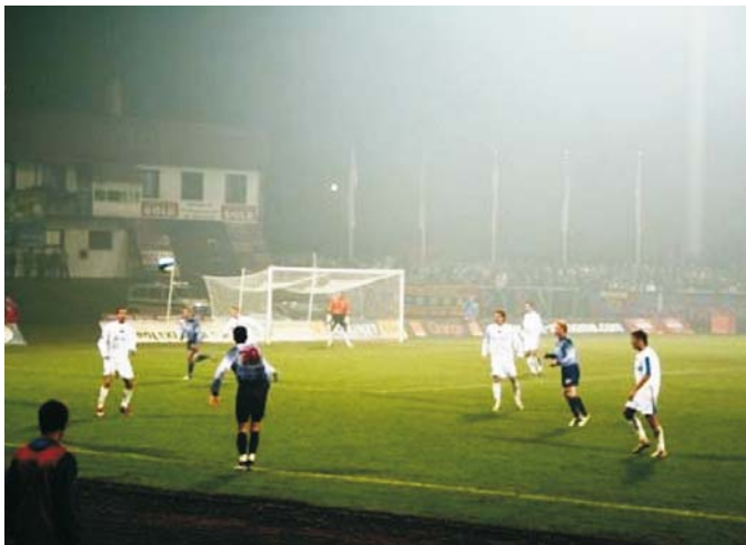
Fragment meczu oglądany z sektora zajmowanego przez naszych kibiców