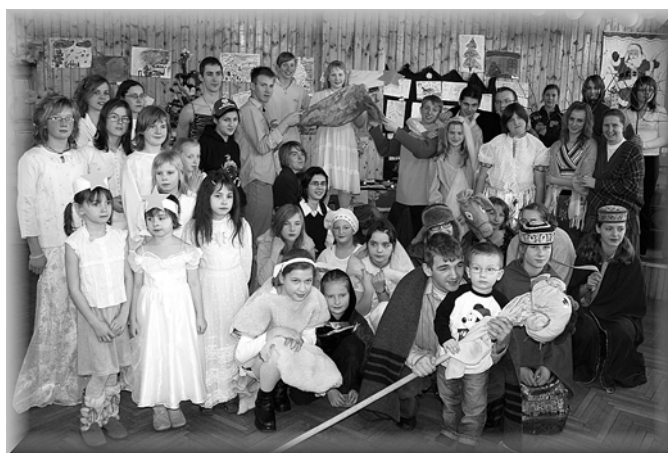
4. Wspólne zdjęcie organizatorów i uczestników akcji