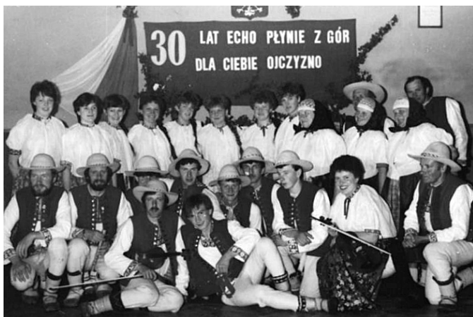
30 lat Zespołu Regionalnego „Jaworzynka” z Jaworzynki