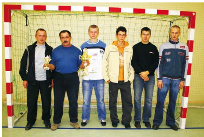
Triumfator Turnieju Firm – zespół „Olzianki”