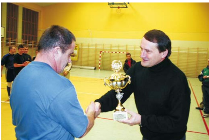
Wręczenie pucharu dla najlepszej drużyny