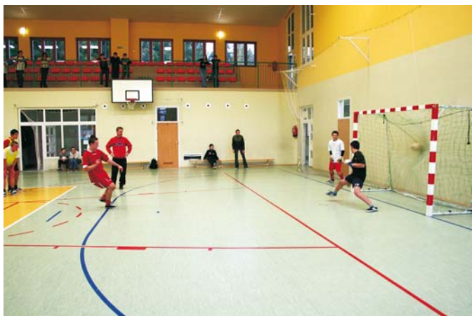
Decydująca bramka w finałowej serii rzutów karnych