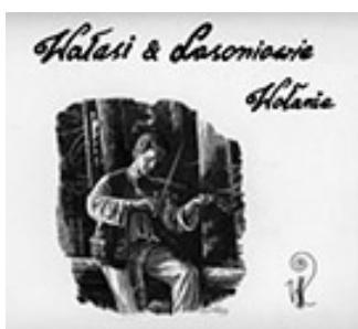
Okładka najnowszej płyty kapeli - „ Wołanie ”

O płytę można pytać w Gminnym Ośrodku Kultury w Istebnej oraz w Marcecie REMA w Istebnej. Niebawem płyta pojawi się w sieci EMPIK.