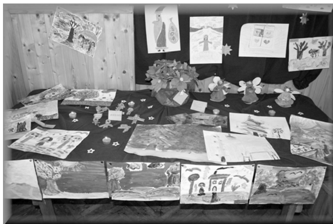
5. Część prac wykonanych przez dzieci

składając sobie życzenia. Potem było wspólne kolędowanie oraz przedstawienie jasełek w wykonaniu dzieci i młodzieży - uczestników akcji. Przedstawienie bardzo się wszystkim podobało. Spotkanie zakończyła wspólna zabawa.