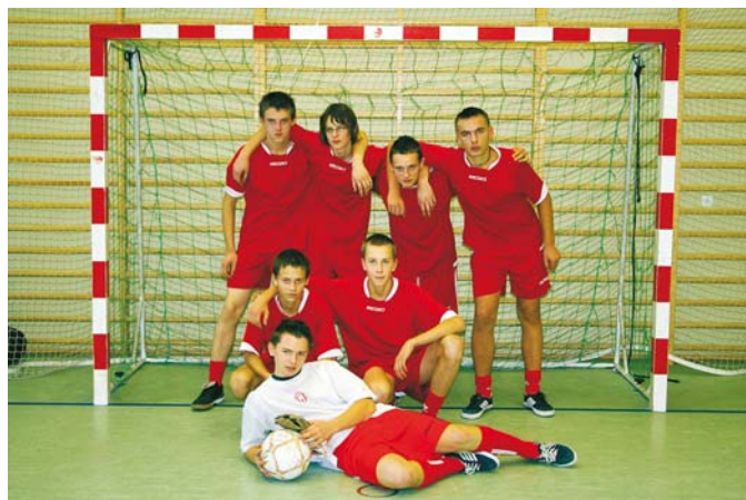
Zwycięzcy imprezy – chłopcy z klasy IIIh.