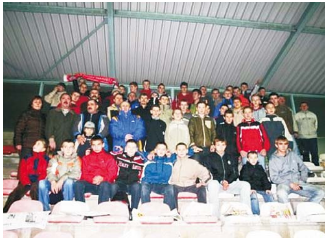
Nasza grupa na trybunach stadionu Odry Wodzisław