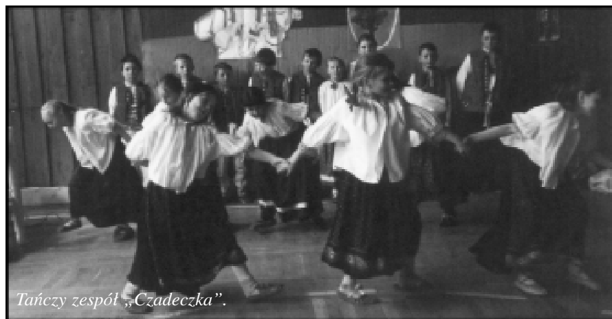
Tańczy zespół „Czadeczka”.

Obecnie zespół „CZADECZKA” przygotowuje się do występu w Cieszynie 27 maja na Wojewódzkim Przeglądzie Zespołów Regionalnych i w Jabłonkowie na „JACKOVE DETEM aneb OD STOŻKU PO BLATNIA”. W dniu 24 maja zespół zatańczy dla wszystkich mam z naszej szkoły z okazji Dnia Matki.