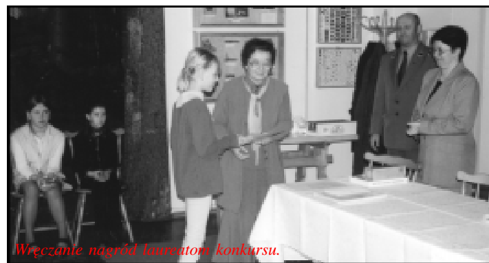
Wręczanie nagród laureatom konkursu.