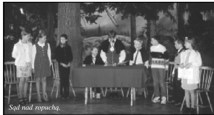
Sąd nad ropuchą.

hasłem „Mój przyjaciel – Przyroda” oraz wręczono laureatom dyplomy, wyróżnienia i atrakcyjne nagrody.