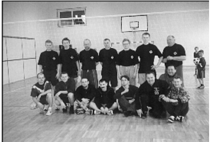
Na zdjęciu: Stoją zawodnicy zwycięskiej drużyny, kłęczą zdobywcy III miejsca

24.03.br. odbył się w Istebnej Turniej piłki siatkowej organizowany przez OSP Koniaków Centrum.