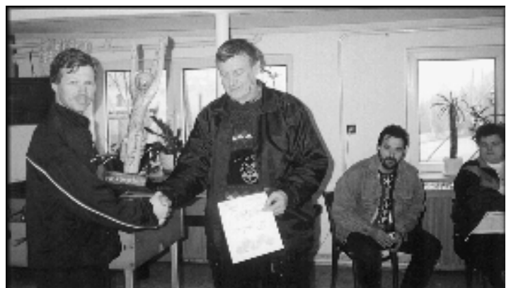
Kapitan drużyny, która zajęła II miejsce otrzymuje puchar z rąk prezesa OSP Koniaków Centrum

Według oceny fachowców i sędziego turniej finałowy stał na bardzo wysokim poziomie". Należy podkreślić też zaangażowanie i ambicję zawodników- amatorów, uczestniczących w tym turnieju. Gratulujemy wszystkim uczestnikom!